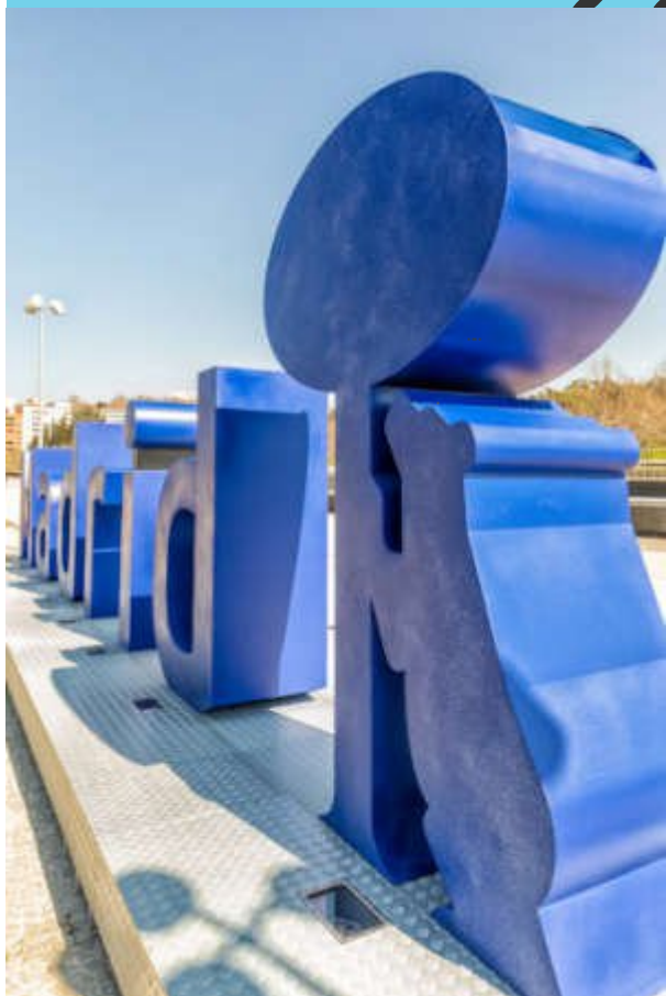
Огромная скульптура из стекла, установленная на

площадке перед мостом Пуэрте-дель-Рей в Мадрид Рио , стала одним из новых символов Мадрида. На заднем плане открывается один из самых узнаваемых панорамных видов города с очертаниями Королевского дворца, собора Альмудена и Королевской базилики Сан Франсиско Эль Гранде. Скульптурная композиция, созданная из переработанного стекла, состоит из слова «Мадрид» и изображения медведицы и земляничного дерева. Эта новая достопримечательность длиной двенадцать метров и высотой почти три метра установлена Городским советом Мадрида и организацией Ecovidrio в честь мадридцев и их высокой экологической культуры.