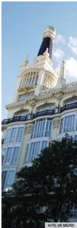
HOTEL ME MADRID