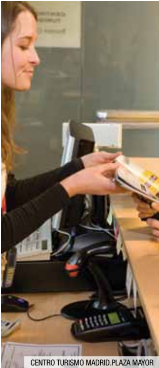
CENTRO TURISMO MADRID.PLAZA MAYOR

Pourriez-vous m'aider ? / ¿Puede ayudarme?