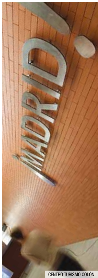
CENTRO TURISMO COLÓN