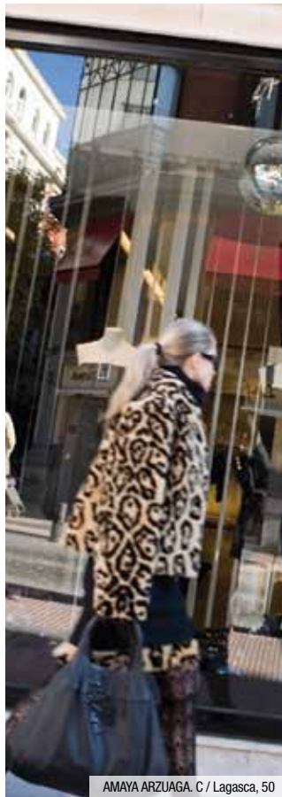
AMAYA ARZUAGA. C / Lagasca, 50

Magasin / Tienda Supermarché / Supermercado Grands magasins / Grandes almacenes Marché / Mercado Magasin souvenirs / Tienda de recuerdos Agence de voyage / Agencia de viajes Banque / Banco Distributeur automatique / Cajero automático Carte de crédit / Tarjeta de crédito Change / Cambio de moneda Chèque de voyage / Cheque de viaje En espèces / Dinero en efectivo Soldes / Rebajas Réductions / Descuentos Gratuity / Gratis TVA / IVA