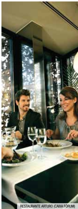
RESTAURANTE ARTURO (CAIXA FÓRUM)

Nappe / Mantel Serviette / Servilleta Assiette / Plato Verre / Vaso Verre à pied / Copa Fourchette / Tenedor Cuillère / Cuchara Couteau / Cuchillo