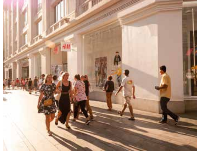
METRO: Banco de España, Gran Vía, Callao, Plaza de España

Una de las principales arterias comerciales de Madrid: las grandes cadenas de moda se mezclan con joyerías, zapaterías y librerías. Fue aquí, en el número 32, donde se construyeron los primeros grandes almacenes que se vieron en España: los almacenes Madrid-París, de principios del siglo XX . Hoy, son una tienda de una conocida marca internacional. También en Gran Vía se apuntan a los nuevos tiempos con centros como WOW, un universo diferente a todo que conecta marcas y creadores (de moda, decoración, lifestyle ...) en un ambiente que se sitúa en el límite entre lo físico y lo virtual. Las marcas internacionales preferidas por los más jóvenes se mezclan con tiendas históricas, fundamentales para entender la historia de la ciudad. Perfectos para hacer una parada, numerosos restaurantes se suceden uno tras otro antes de que la calle se convierta en la gran avenida del teatro rumbo a la Plaza de España, donde abre sus puertas el Zara más grande del mundo.