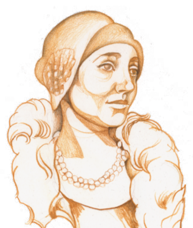
Calle de San Andrés, 24

Rosa Chacel (1898-1992) de niña vivió en este edificio. La huevería y la farmacia Juanse, en los números 30 y 28, se mencionan en su libro Barrio de Maravillas . También habla de esta casa en sus memorias Desde el amanecer . Rosa quería ser escultora pero por diversas causas tuvo que desistir. Desde 1927 sus frecuentes estancias en el extranjero se enlazaron con el exilio. Fue una novelista muy singular. Tan singular como ella misma.